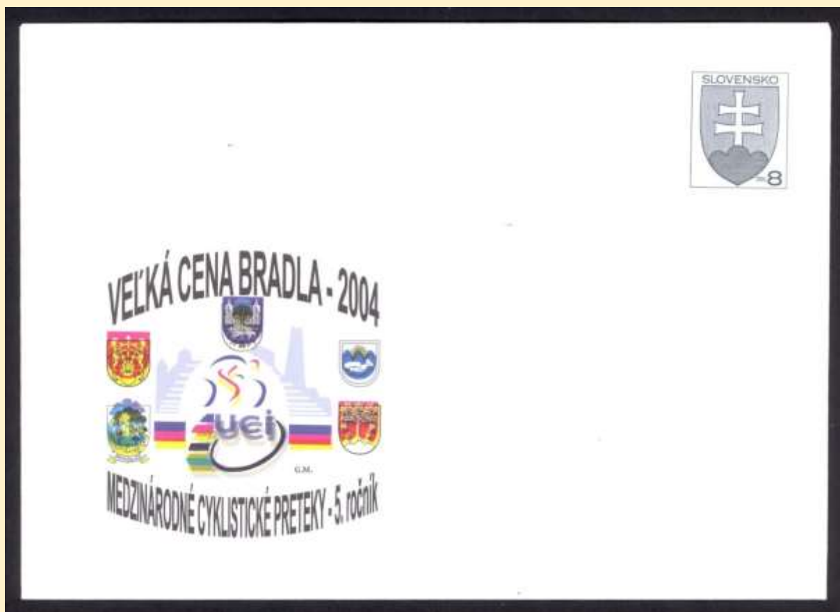
COB067 s posunom červenej a modrej farby prítlače