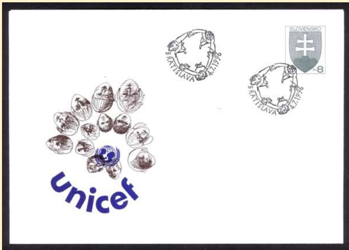
COB011 s posunom farieb prílače

Na prvom exemplári COB011 je zreteľný posun čiernej farby smerom nahor a vpravo.