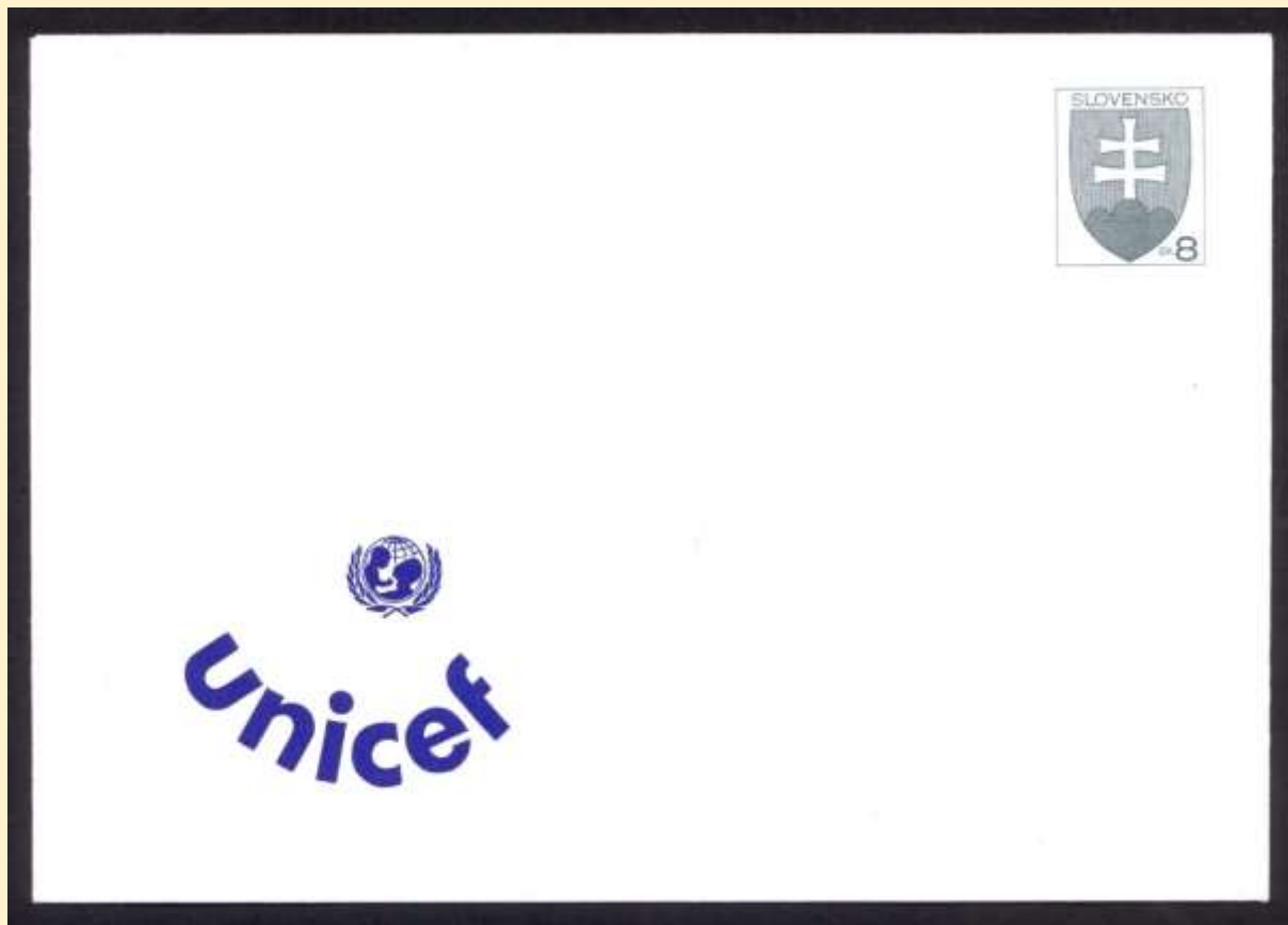
COB011 s vynechanou čiernou farbou prítlače

Na druhom exemplári je natlačená iba modrá farba a na mieste chýbajúcej čiernej kresby je jej plastický reliéf – tzv. „slepá tlač“ (na obrázku je nezreteľný). Pri tlači čiernou farbou sa buď do stroja dostali súčasne dve pôvodné obálky COB001 a spodná ostala nepotlačená alebo na tlačovú platňu (štočok) nebola nanosená čierna farba.