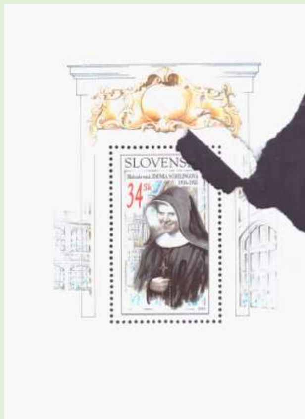
Hárček 350 s papierovou zložkou

Predložený hárček má papierovú zložku, ktorá vznikla tak, že bol potlačený a perforovaný potrháný a pokrčený hárok papiera. Pri kontrole mal byť tento hárček vyradený do makulatúry, medzi nepodarky.