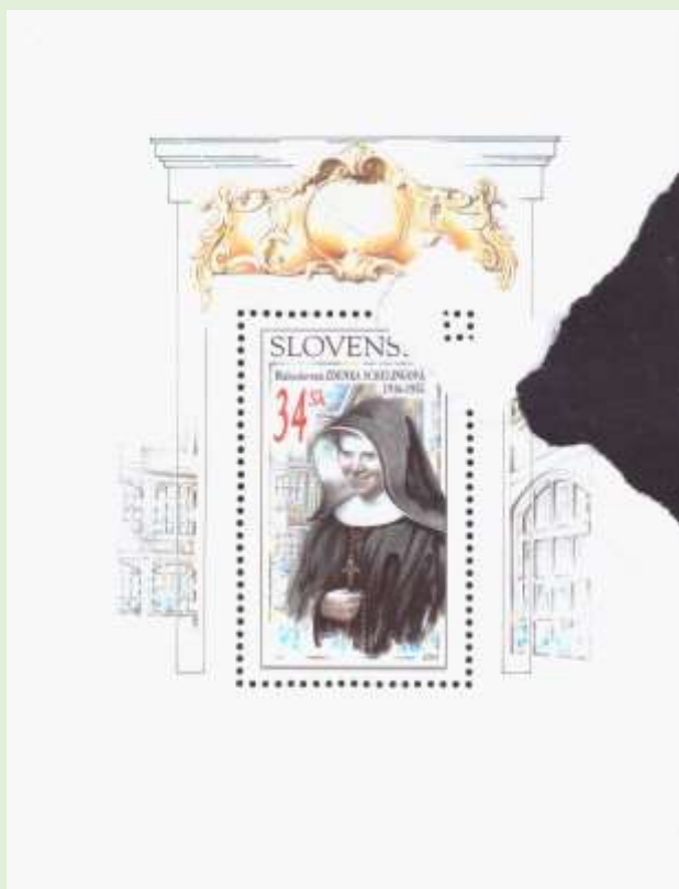
Hárček 350 s rozloženou papierovou zložkou

Predložený hárček má papierovú zložku, ktorá vznikla tak, že bol potlačený a perforovaný potrháný a pokrčený hárok papiera. Pri kontrole mal byť tento hárček vyradený do makulatúry, medzi nepodarky.