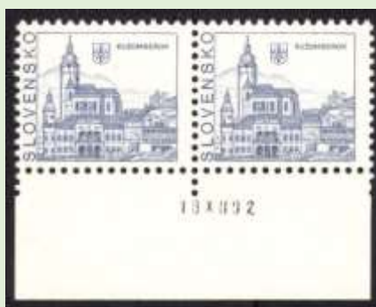
Dvojpáska známok 3 s vynechanou hĺbkotlačovou farbou

Na predloženej dvojpáske s dátumom tlače 18 XII 92 chýba nominálna hodnota, tlačená oranžovočervenou hĺbkotlačovou farbou. Menšie posunutie perforácie známok naznačuje, že by mohlo ísť o tzv. nájazdovú makulatúru, ktorá vzniká pri spustení rotačky – jej postupným zapínaním.