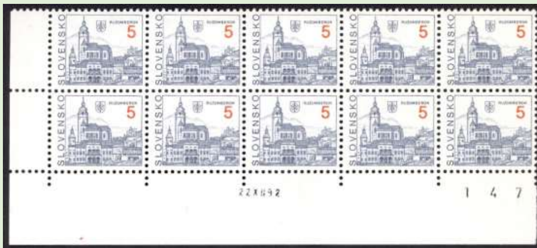
Rohový 10-blok známky 3 s dátumom tlače a časťou čísla listu

Známka č. 3 „Ružomberok“ bola vydaná 31. januára 1993 v náklade 5,47 miliónov kusov. Známkou navrhol a vyryl Josef Herčík. Vytlačená bola kombináciou hĺbkotlače a oceľotlače rotačkou Wifag.