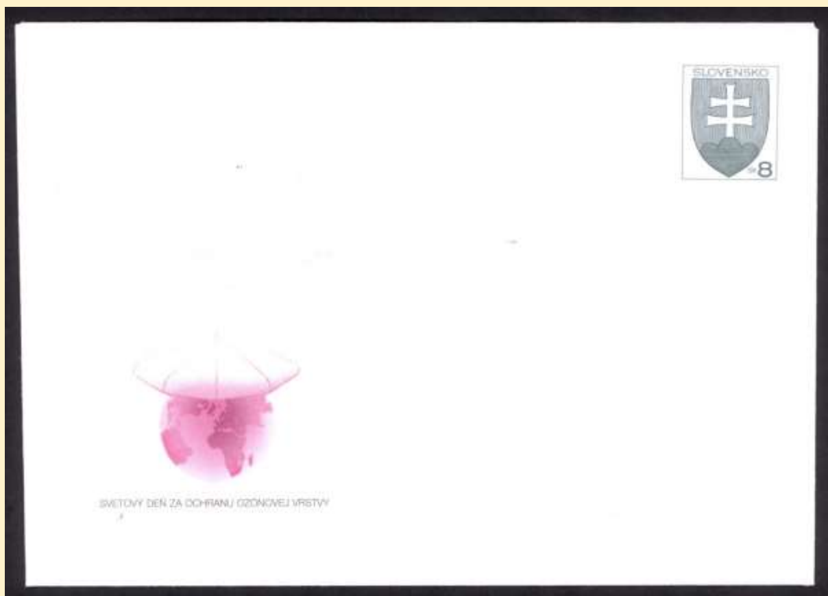
COB021 s vynechanou modrou a žltou farbou